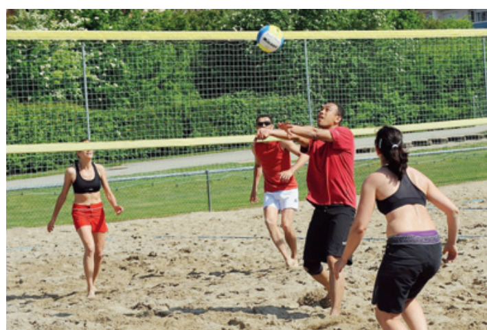
Match de beachvolley dans le cadre du Duel intercommunal de la Suisse bouge, à Hauterive en 2009.